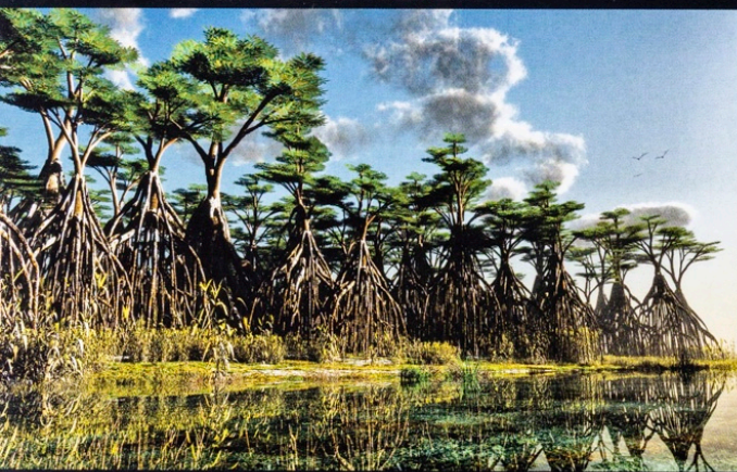
Imaginée par le paléontologue Jean-Sébastien Steyer, cette néo-mangrove du futur, peuplée d'arbres gigantesques, pourrait abriter les crocodiles d'ici dix millions d'années.

Les écailles (peu visibles ici) et les plaques osseuses recouvraient le dos des stégocéphales. Ces structures auraient permis à ces animaux à sang froid de s'adapter aux conditions climatiques.